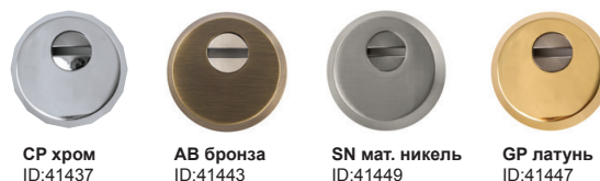
CP хром ID:41437