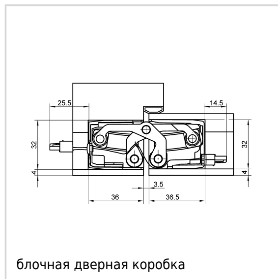
блочная дверная коробка