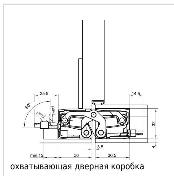
охватывающая дверная коробка